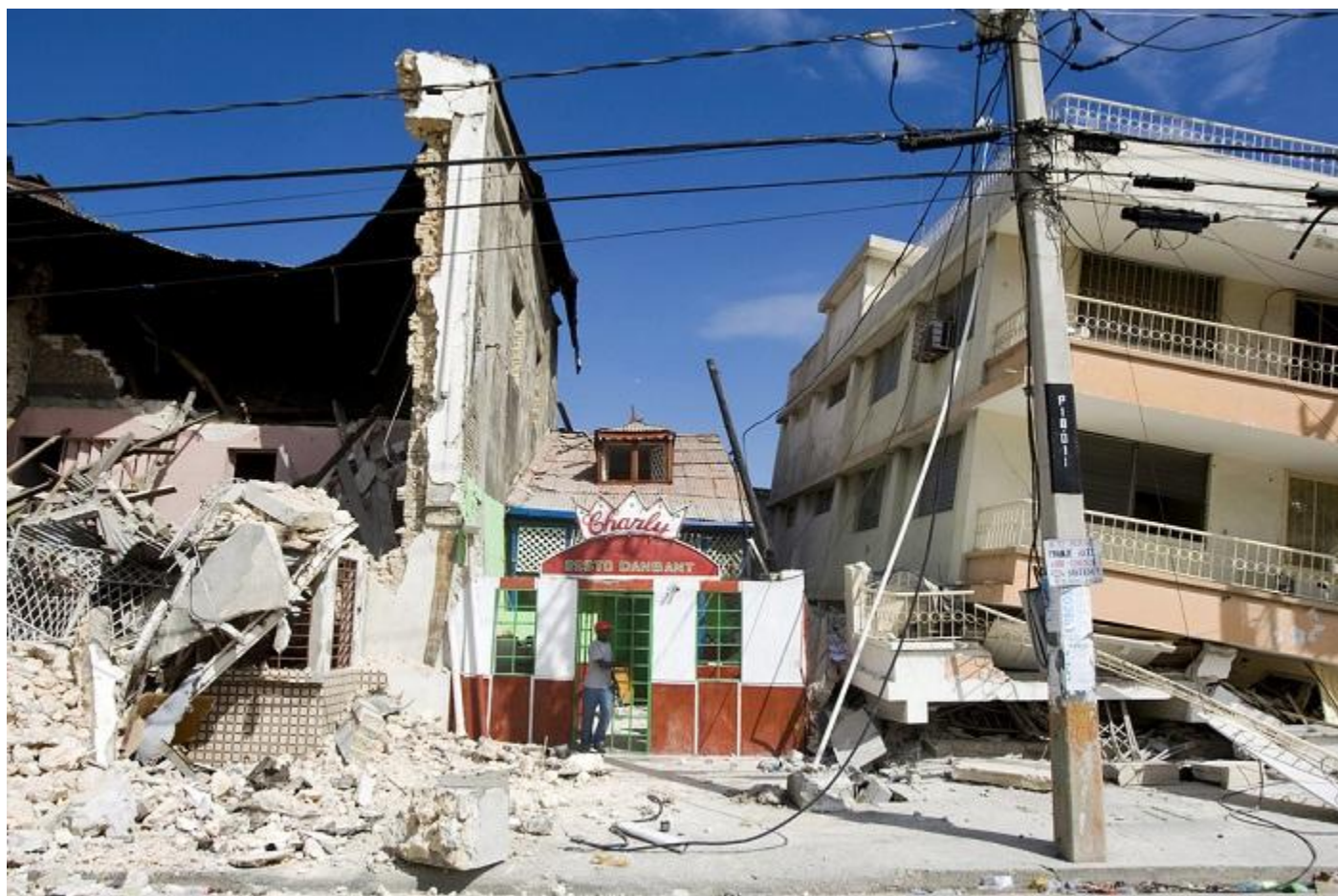
United Nations Development Programme

בכל מקרה שהוא – אל תדליקו אש או תפעילו מכשירים חשמליים! דליפת גז היא אחת מההשלכות המסוכנות שנגרמות כתוצאה מרעידת אדמה שעלולה לגרום לשריפה ולפיצוץ. אם אתם מבחינים באנשים שנלכדו בסביבתכם אל תנהגו בפזיזות כדי להוציאם - אלא הפעילו לפני כן שיקול דעת שכן ההריסות עצמם רעועות ולא יציבות. השתמשו בחפצים ביתיים כמו מוט ברזל או מגבה למכונית (ג'ק) על מנת לחלצם והגישו להם עזרה ראשונה במידת האפשר.