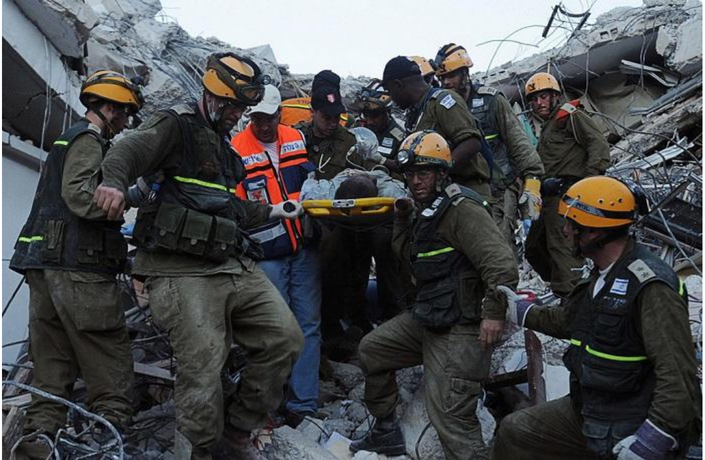
Israel Defense Forces